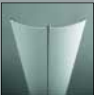
S 2300 S 2300