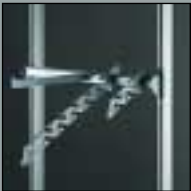
newline SHOP newline SHOP