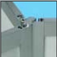
S 250 S 250