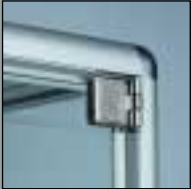
newline CORPUS newline CORPUS