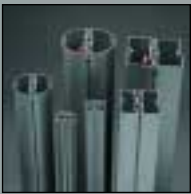
Maxima light Maxima light