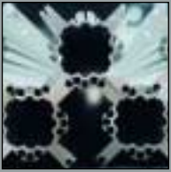
Doppelform Double Form